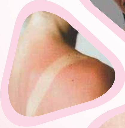
வெயிற்பட்ட மேனி நிறம்